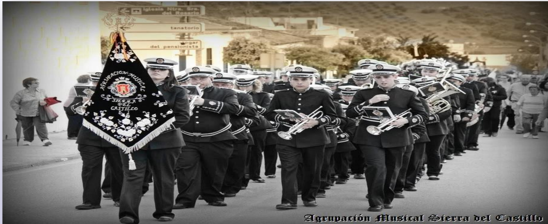
Agrupación Musical Sierra del Castillo